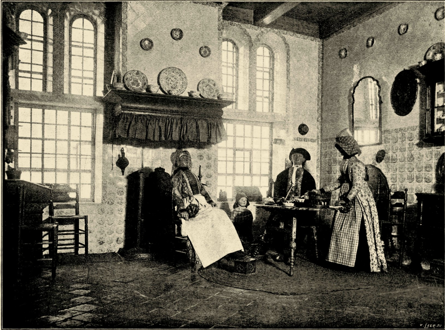
De Hindelooper kamer.