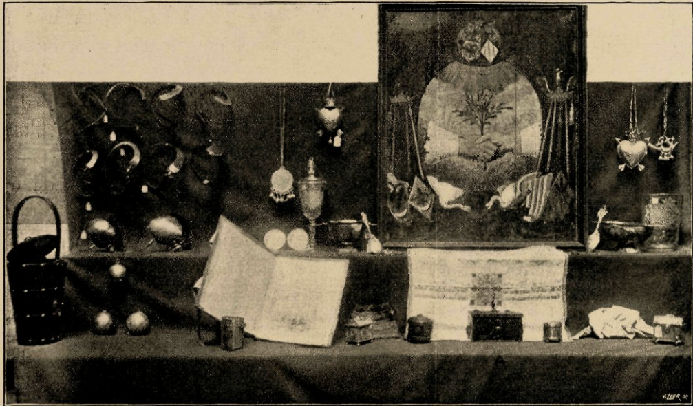
Vrijen, trouwen, kraamkamer, enz.