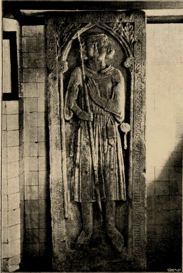
Grafsteen van Eppo.

In een keldertje hiernaast zijn een aantal voorwerpen van allerlei aard geborgen, die nog gerangschikt moeten worden: kogels, oud aardewerk, steenen beelden, oude uithangborden enz. In een aangrenzend vertrek zijn grafsteenen, eigenlijk deksels van steenen lijk-kisten tegen den muur opgesteld. Hier ziet men naast het raam een roodzandsteenen kistdeksel, dat gevonden is te Rinsumageest ten westen der kerk. De hierbij behorende kist, door een boer gebruikt als drinkbak voor kalveren, is verloren gegaan. Deze steen dagtekenend van 1341, is nog in goeden staat. Er staat op afgebeeld een baardeloos jongeling met tamelijk lange lokken,