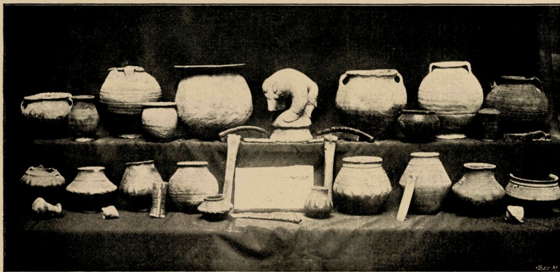
Steenen beer, urnen, enz.

dorp Nijega in Hemelumer Oldefaert. Andere gedeelten van een boerenwagen, op dezelfde plaats gevonden, zijn verloren gegaan. Ook te Hijum is een wagenwiel gevonden met een middellijn van ruim 1 M., geheel overeenkomende met dergelijke raderen, gevonden in andere landen, waar de Romeinen oudtijds hebben geheerscht. Een groote pot, een romeinsch vat of dolium, waarop met ingekraste letters te lezen staat: Pondo libras CIV. — Vier beitels en een potscherf uit een steenen graf, in Maart 1849 gevonden in een bosch van het landgoed Rijs, in Gaasterland. Dit steenen graf of hunebed is uitvoerig beschreven — met afbeelding — in dl. V en VI (1850 en 1853) van het tijdschrift De vrije Fries uitgegeven door het Fr. Genootsch. v. Gesch., Oudh. en Taalk. — Een ruw bewerkte vuursteenbeitel, gevonden te Donkerbroek, 2 M. diep in het veen, een dolk van vuursteen, uit het veen te Haule, een fluitje van gebakken aarde uit den tijd van Lodewijk den