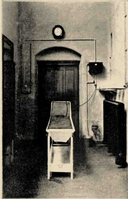
OPERATIEZAAL: DE SPOEITAFEL.

zich de operatie (resp. demonstratie-)ruimte*), midden in 't amphitheater liggend, aansluit.