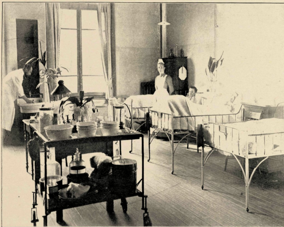
KIJKJE IN EEN DER MANNENZALEN.

Elke kinderzaal heeft midden-in een lange lage tafel; kleine stoeltjes staan er aan geschoven. Daar mogen kleintjes, die niet meer bedlegerig hoeven zijn, aan spelen, lezen,