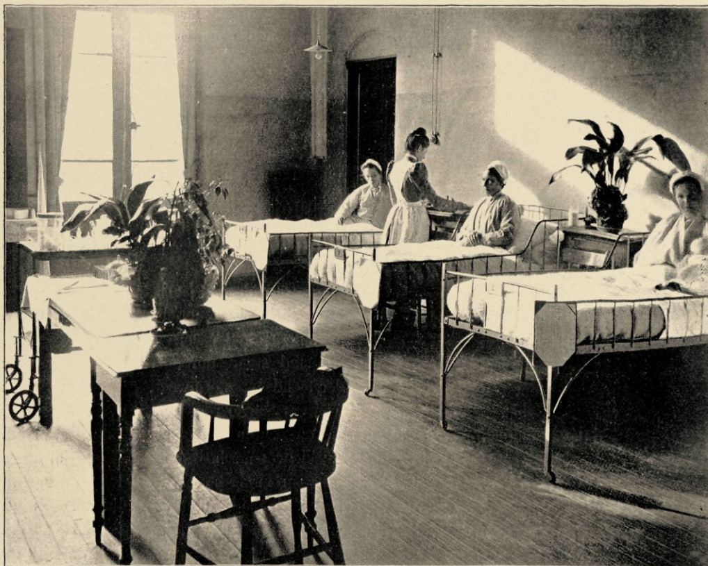
KIJKJE IN EEN DER VROUWENZALEN.

Professor zag het dadelijk, liet 't gordijn wat zakken. Een vriendelijke blik tot dank.