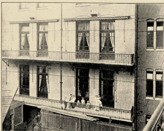
HET NIEUWE ZIEKENHUIS: ACHTERGEVEL VAN DEN LINKERVLEUGEL.