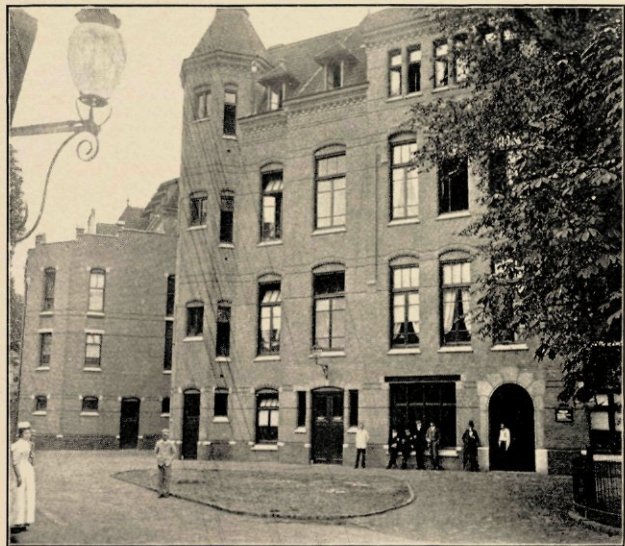
HET NIEUWE ZIEKENHUIS: FRONTGEVEL.