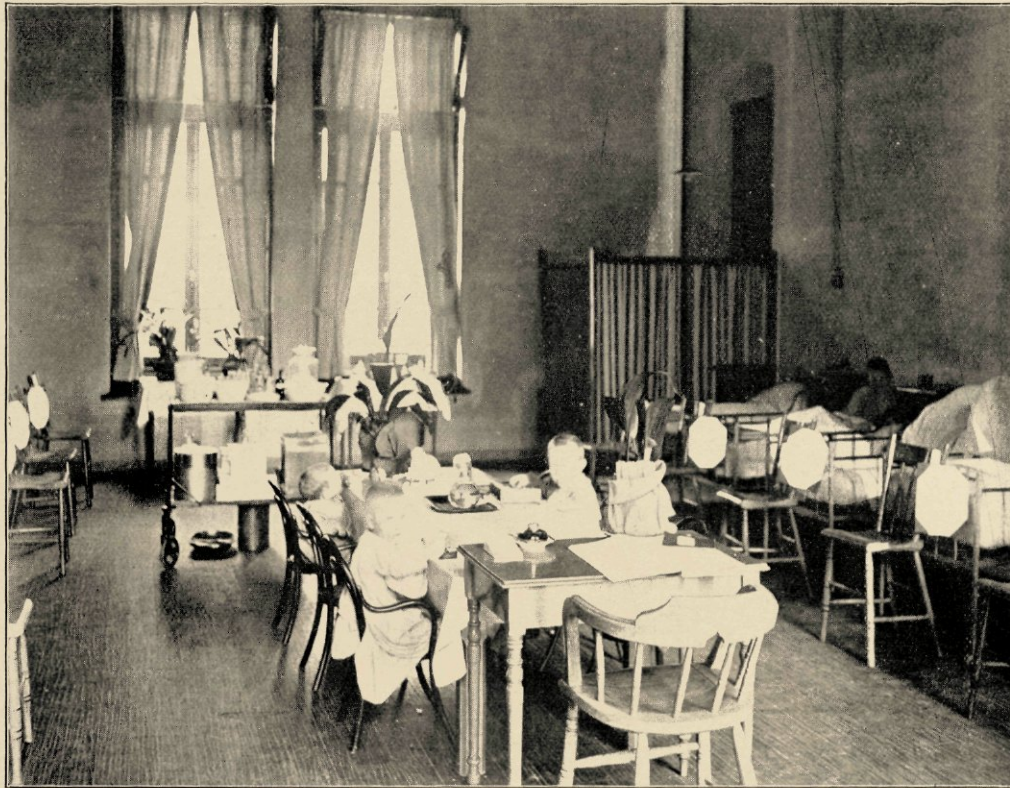
KIJKJE IN EEN KINDERZAAL.

schrijven *) — Het kastje in den hoek bevat, met medicamenten, ook het speelgoed. Wie nog niet opstaan mag, dien wordt het op z'n bed gezellig gemaakt, die krijgt een plank, met gleuven passend op het ijzer van z'n ledikant, tot tafel, of z'n beddegoed wordt opgehoogd, de lei daar prettig tegenaan gelegd.