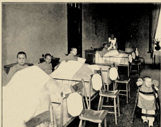
KIJKJE IN EEN DER KINDERZALEN.

ook een om jaloersch van te zijn! *) — de anderen recht-op in hun bedjes, zoo smakelijk nieuw en helder, de glimmend ijzeren ledikantjes, de roomkleurige dekens van vlokke wol, de rose-gestreepte hansopjes, wijd-plooiend om de tengere beweeglijkheid der schouder-tjes, de ronde kinderbolletjes daar boven uit, armelijke gezichtjes met iets van zorg, iets vroeg-ouds, maar in de kijkende oogjes een zacht-dankbare blijheid, o! iets heel weldadigs, maar dat ook beschamend was. In die oogten vooral was 't ons verrassende, het onverwachte. . . .