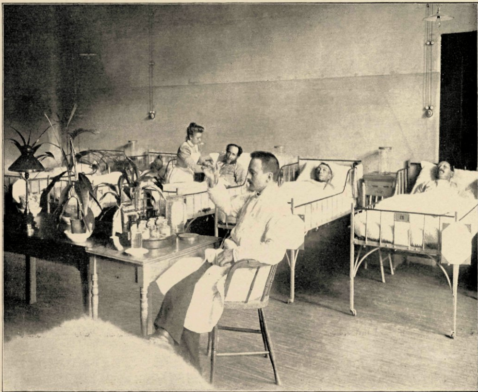
KIJKJE IN EEN DER MANNENZALEN.

Een kleine houten trap voert van den klokketoren naar het platte dak. Daar moesten we natuurlijk ook naar toe, — de aantrekkingskracht van 't hoogste punt! — Professor ging voorop; hij stootte met de handigheid, bevaren schippers eigen, 't dakluik open, en we kropen één voor één er uit... We stapten op het grind... en werden overweldigd, dadelijk!... O! 't ruime, wijde, o! de glanzing van het hooge hemelblauw, de oneindigheid der verten in witte wazen!... De stad stond om ons heen, een dakenzee versteend bij stormweer, grootsch, onafzienbaar..., maar de hemel overkoepelde het ál, en 't was als één enorme hal van licht en kleur en schoonheid... Had al straks, beneden in de straat, de heldere morgen, 't pure licht, de glinsterende hemel ons vervroolijkt, hier kwamen we in een gemoeds-