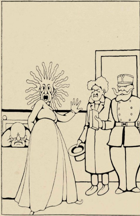
zinnige moeder het boek zag, geraakte zij nog verder buiten zich zelve.