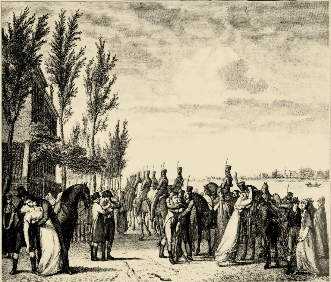
HET VERTREK VAN DE „GARDES D'HONNEUR" VAN AMSTERDAM, BUITEN DE WEESPERPOORT. PRENT VAN R. VINKELES, NAAR EEN TEEKENING VAN A. VINKELES.

kundig leven zijn overgehouden uit de jaren toen dat juk op onze schouders drukte. Dit wordt zelfs al openbaar uit de allereerste bladzij der interessante „inleiding", die zij aan de grootere afdeelingen voorafgaan deed. Immers reeds daar verklaart de schrijfster het feit der toenemende belangstelling onzer historici in dien z.g. Franschen tijd als volgt: „Voor een deel moge dit verschijnsel zijn toe te schrijven aan het naderen der herinneringsdagen van het verlies onzer onafhankelijkheid