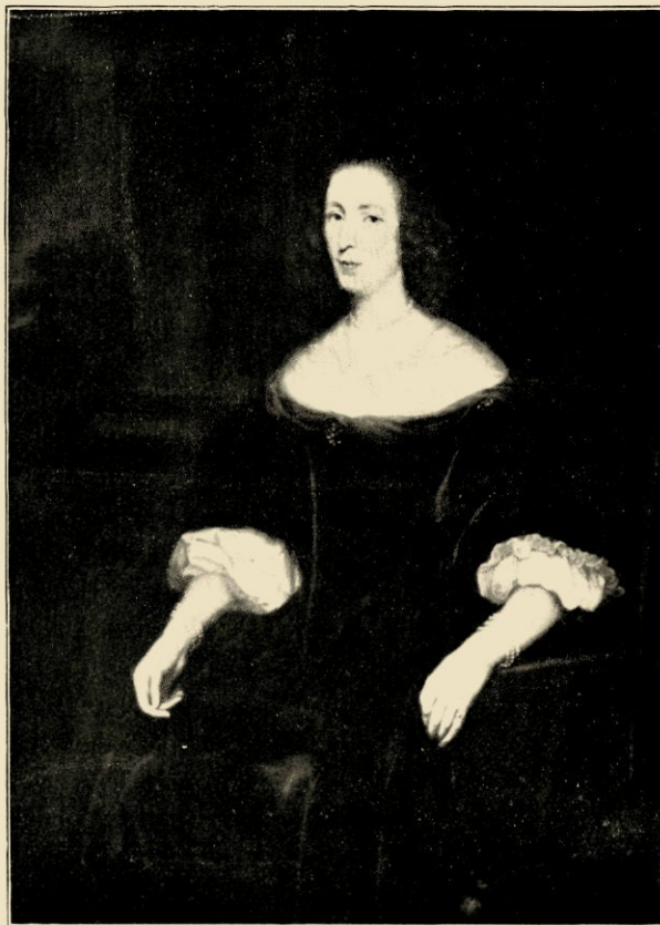
ANNA VAN DE CORPUT, ECHTGENOOTE VAN JACOB DE WITT, (NAAR SCHILDERIJ VAN J. DE BAEN, MUSEUM TE DORDRECHT).

We hopen elders nog meer dan eens van onzen grooten