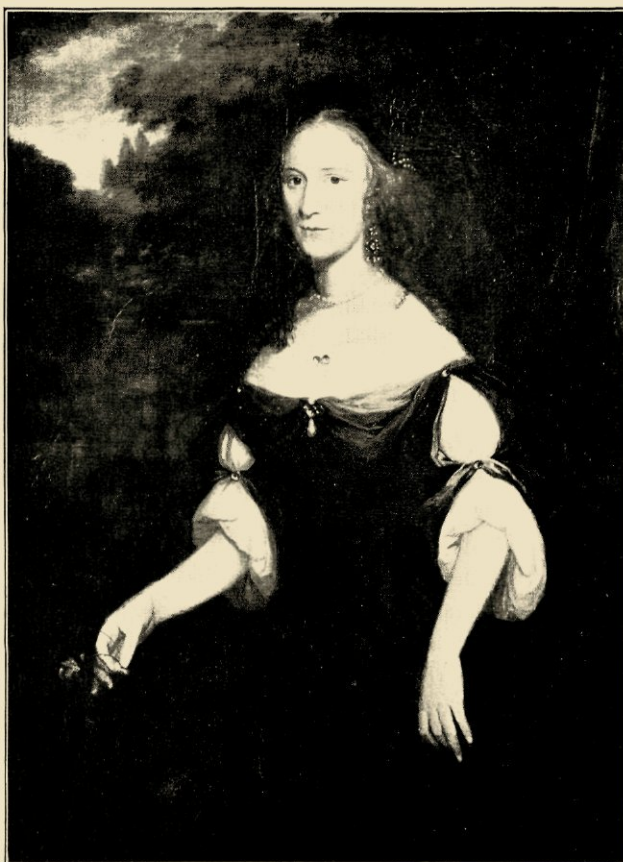
WENDELA BICKER, ECHTGENOOTE VAN JAN DE WITT, (NAAR SCHILDERIJ VAN H. VERELST 1667. RIJSMUSEUM, AMSTERDAM).

Het kan niet ontkend worden dat hij, die alles behalve een drommer was en drommels goed uit zijn twee heldere oogen wist te kijken, meer dan eens den bloei van den Staat met den bloei zijner eigen zaken in overeenstemming zal gebracht hebben. Maar oneerlijk was hij niet. Zeker, hetgeen Petrus Valkenier hem verweet, „dat hij groot profijt hadde gedaan door penningen op 's Lands comtoiren te beleggen