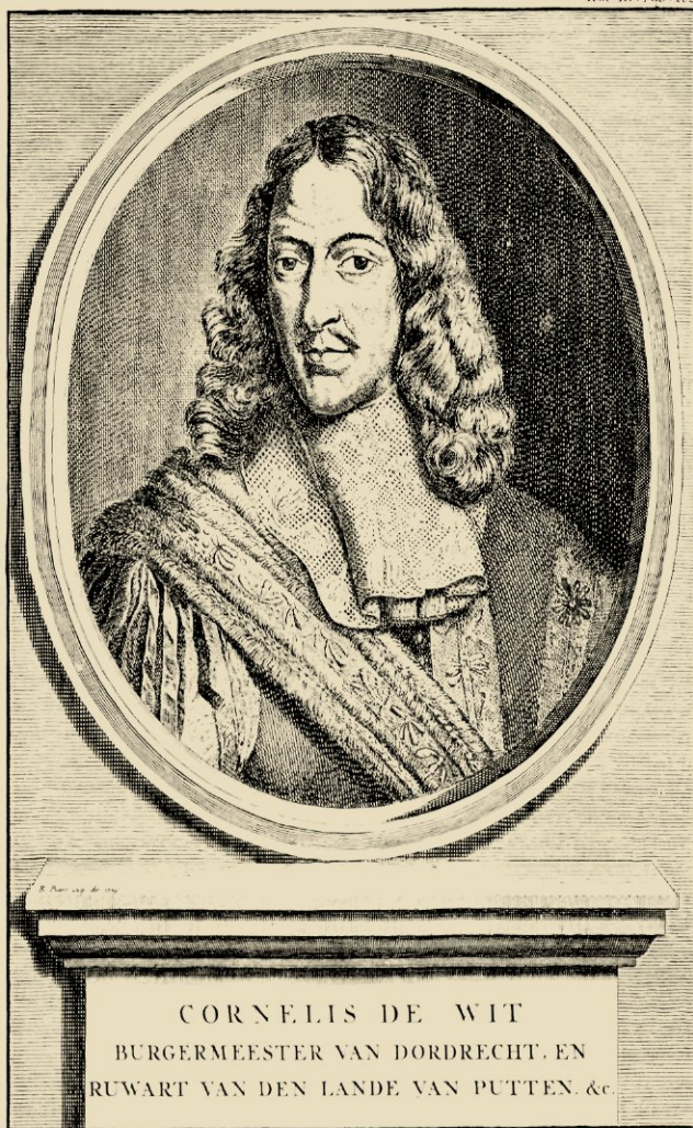
CORNELIS DE WIT, REPR. NAAR KOPERGRAVURE VAN B. PICART.