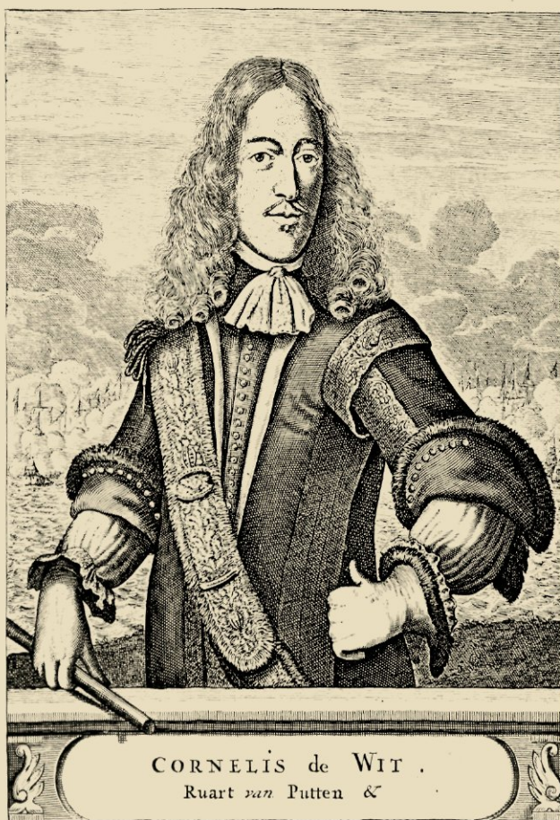
CORNELIS DE WITT, REPR. NAAR KOPERGRAVURE VAN C. HAGEN.