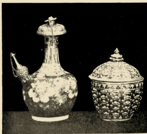
SAUSKOM EN KENDI MET ZILVEREN DEKSEL EN TUIT.