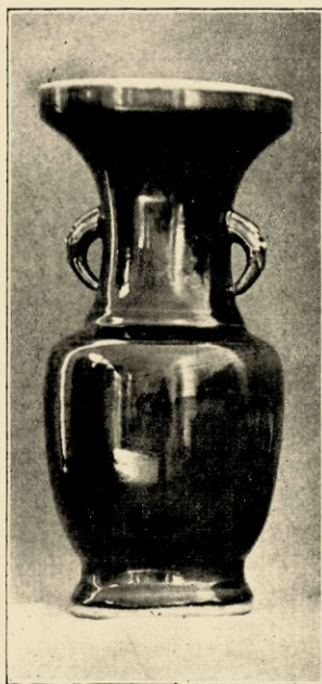
IRON BROWN VAAS.