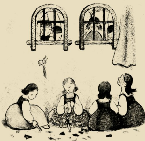
ILL. UIT „RAADSELS.” „DAAR WAREN VIER ZUSTERTJES.”