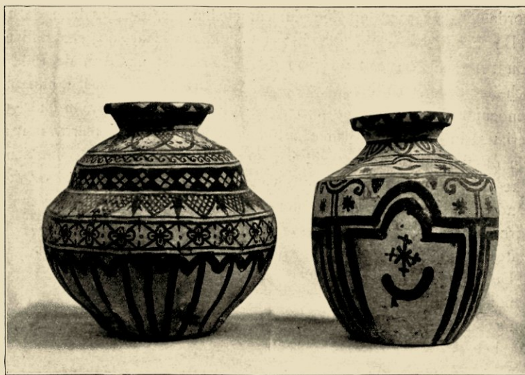
AARDEWERK VAN DE KEI-EILANDEN.

De vormen en de versiering van het aldus behandelde vaatwerk beschouwend, zou men wenschen, dat al dergelijke methoden overal elders in de centra van Inlandsche, ceramische nijverheid navolging vonden. Met een gerechtvaardigde beslistheid heeft dan ook