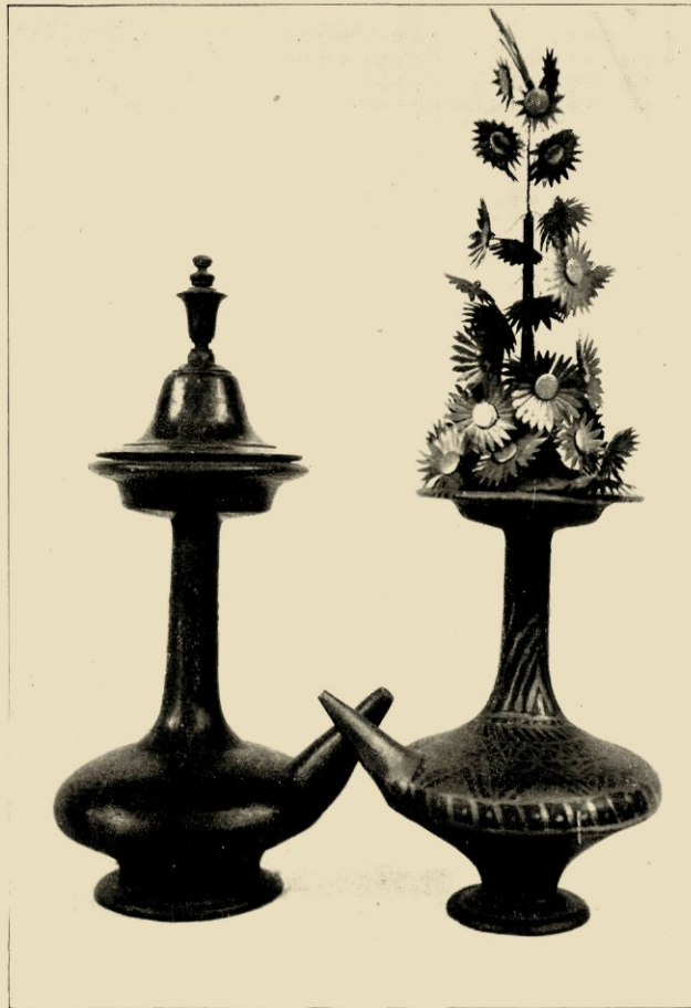
KENDI'S VAN BALL.

De aarden lamp was in oude tijden niet alleen op Java in gebruik, diende ook in Midden-Sumatra bij feestelijke gelegenheden tot verlichting van de Maleische woning.