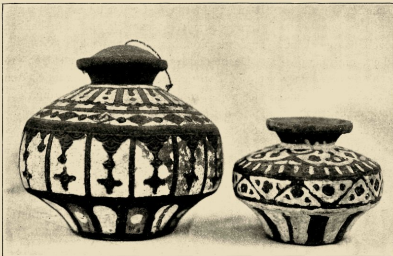
AARDEWERK VAN DE KEI-EILANDEN.

de aanrakingsdruk van de hand in een zeker tempo wordt uitgeoefend, om in den rand blanke plekjes uit te sparen.