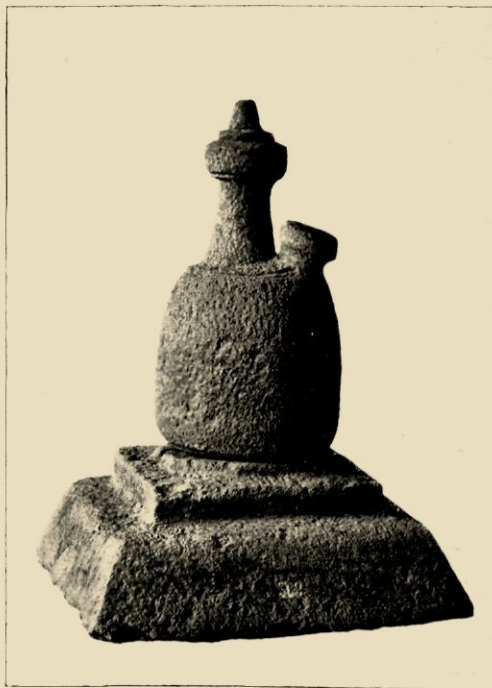
OUD-HINDOESCHE, STEENEN KOENDI (AANWEZIG IN HET BATAVIAASCH MUSEUM).

Toch moet de vervaardiging van aardewerk in Nederlandsch-Indië als iets zuiver Indonesisch worden beschouwd, de huisvlijt van zeer oude, primitieve volken, een voor het dagelijksch leven hoognoodige handenarbeid, waaruit zoetjes aan het versieringsontwerp ontstond en welks producten geen vormwijziging hebben ondergaan door den invloed van den toenmaals reeds vrij uitgebreiden importhandel van Chineezers.