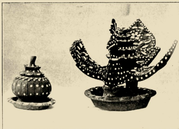
AARDEWERK UIT BATOEBARA (SUMATRA'S OOSTKUST). RECHTS EEN PERBAROAN (WIEROOKBRANDER), LINKS EEN POTJE IN DEN VORM VAN EEN MANGGISVRUCHT.