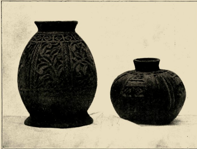
AARDEWERK UIT BONTHAIN (ZUID-CELEBES). RECHTS EEN WANGIENG (WATERKRUIK), LINKS EEN ADEMÈNG-ASELIE (HOUDER VOOR SPOELN EN SPOELKOKERS).

welke de wenschelijkheid aanduiden, dat aan dezen tak van nijverheid een hogere ontwikkeling worde gegeven. Vorm, versiering van het voorwerp zijn bijna altijd in overeenstemming met den aard van het materiaal. De opbouw wordt verricht met fijne, lenige vingers, die als van zelf de klei be-