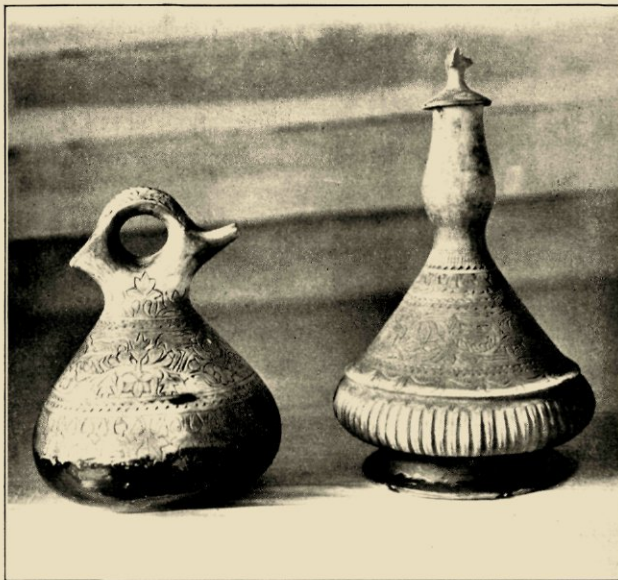
AARDEWERK VAN LANGKAT (SUMATRA'S OOSTKUST). RECHTS EEN KENDI (KALABAS-VORM), LINKS EEN KENDI PRATOELA.

klei op haar schoot behandelt. De techniek brengt mee, om dan de grondstof iets vochtiger, soepeler, gemakkelijker kneedbaar te nemen, hetgeen weer tot gevolg heeft, dat de vorm na elk stadium van bewerking in den wind dient te worden gedroogd. Bij het uitdijend bekloppen, dat nu volgt, bedient