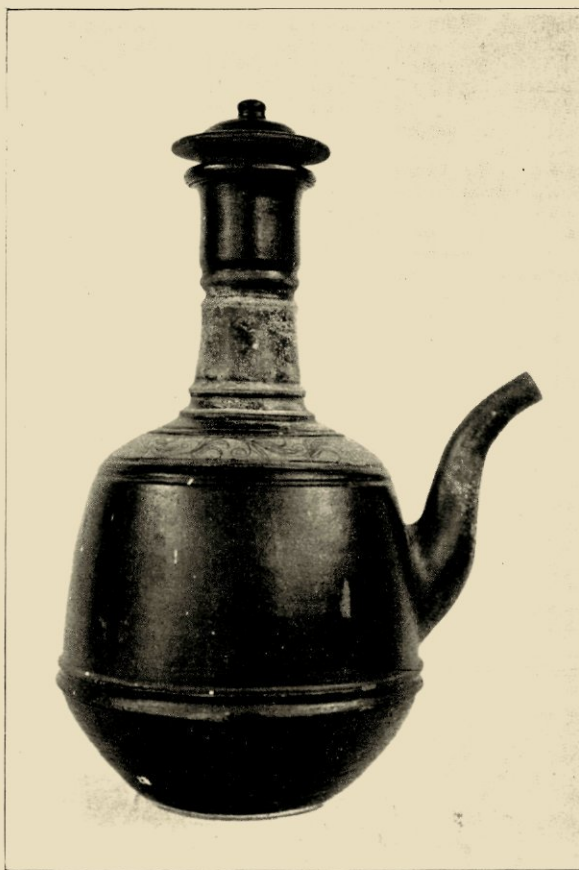
AARDEN KENDI VAN PLÉRÈD.

Wat wèl vaak wordt toegepast en bij juiste uitvoering even goede effecten geven kan, is de beschildering van het aardewerk, hetzij vóór, of na het bakken hiervan. De ceramische verfmengsels, die aan het Westersche,