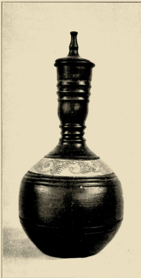
KENDI VAN PLÈRÈD (JAVA).

aanrakingsvlakte een globaal figuur kan vormen. De hand is in op-en-neergaande richting in beweging, om een slinger- of zigzag-rand te kunnen vormen. En bovendien oefenen de vingers systematisch drukjes uit, tengevolge waarvan sommige deelen van het lapje-oppervlak den wand sterker aanraken dan andere, terwijl dan nog bij de toepassing van dit eigenaardige versierings-procédé