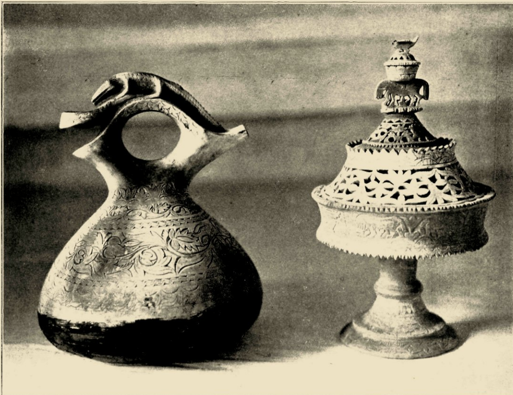
AARDEWERK VAN LANGKAT (SUMATRA'S OOSTKUST). RECHTS EEN VRUCHTENSCHAAL, LINKS EEN KENDI PRATOELA.

als luxe voorwerpen in gebruik zijn bij de eigen bevolking van het land, kan men zien, hoe het bescheiden bedrijf zich door al zijn primitiviteit heen heeft weten te ontwikkelen tot een in zijn geure zeer aantrekkelijk handwerk, bij de beoefening waarvan de kunstzin van den Inlandschen nijvere ongedwongen tot uiting komt.