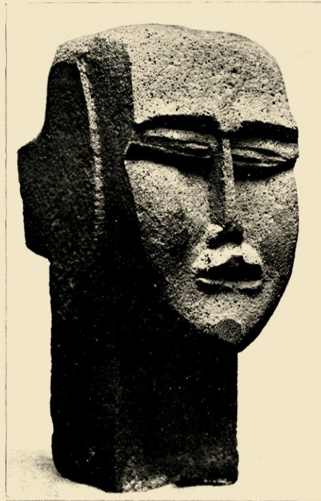
O. ZADKINE. VROUWEEKOP. VULKAANSTEEN. 1924. VERZ. L. MANTEAU, BRUSSEL.