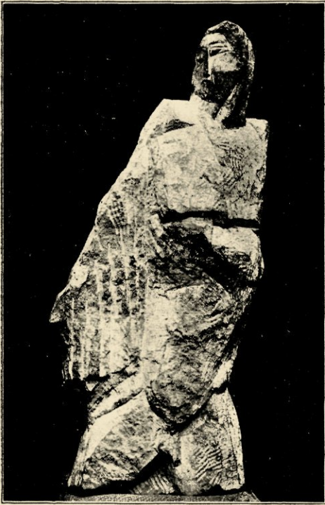
O. ZADKINE. DE GLADIATOR. STEEN. 1920.