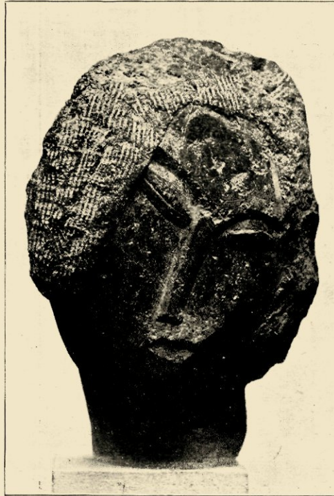
O. ZADKINE. MEISJESKOP. GRANIET. 1921. VERZ. A. SIEGFRIED, PARIJS.