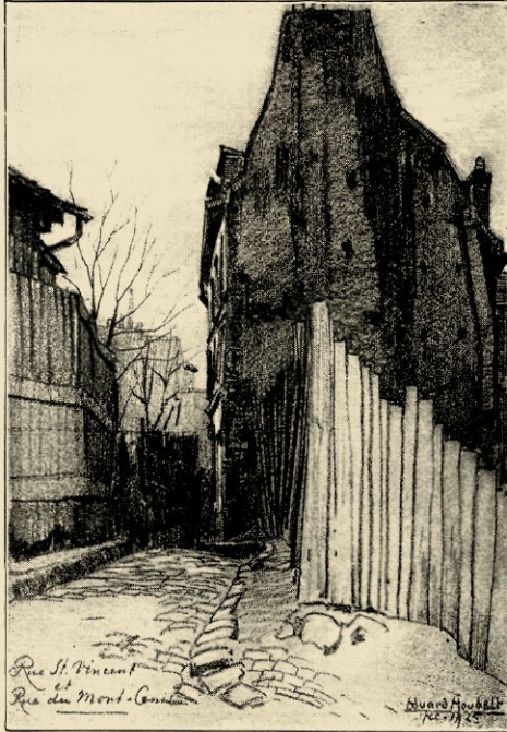
RUE ST. VINCENT.