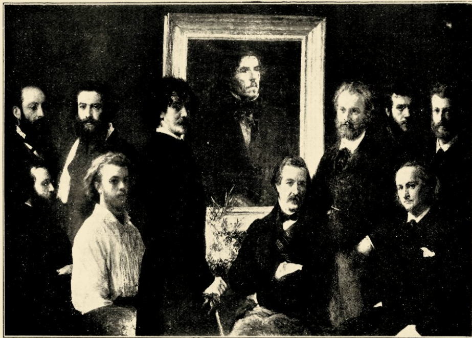
H. FANTIN LATOUR. HULDE AAN DELACROIX (1864). (COLLECTIE MOREAU-NÉLATON). V. L. N. R., ZITTEND: DURANTY, FANTIN, CHAMPFLEURY, BAUDELAIRE; STAAND: CORDIER, LEGROS, WHISTLER, MANET, BRACQUEMONT, DE BALLEROY.