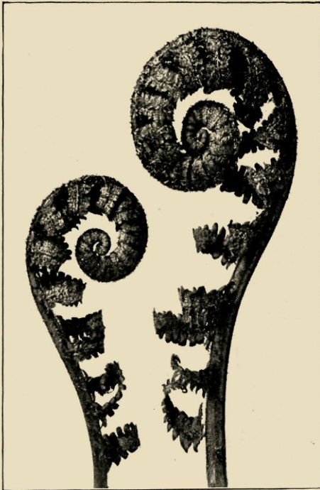
ASPIDIUM FILIX MAS. NAALDVAREN. JONGE OPPEROLDE BLADEREN, VERGROOT. UIT: BLOSFELDT, URFORMEN DER KUNST. UITG. WASMUTH A. G., BERLIJN.