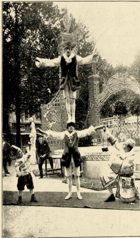
FOIRE ST. GERMAIN, 18E EEUWSCHE ACROBATEN.