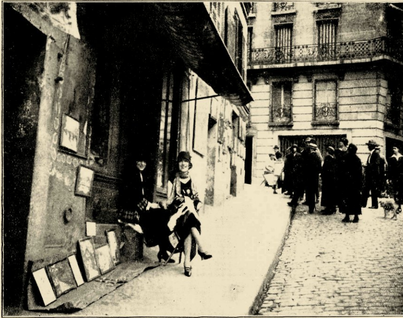
FOIRE AUX CROÛTES OP DE BUTTE MONTMARTRE.