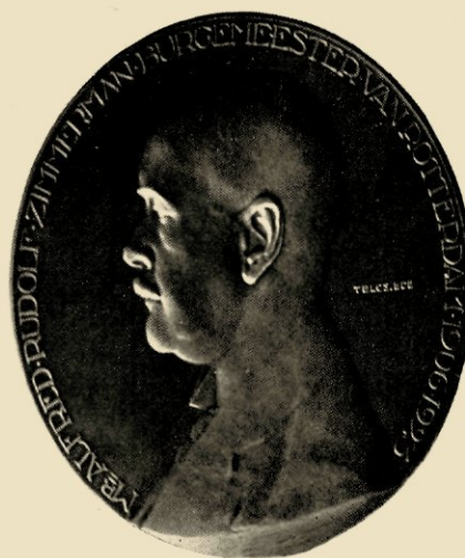
ED. TELCS: GESLAGEN BRONZEN PENNING ZIMMERMAN (WARE GROOTTE)