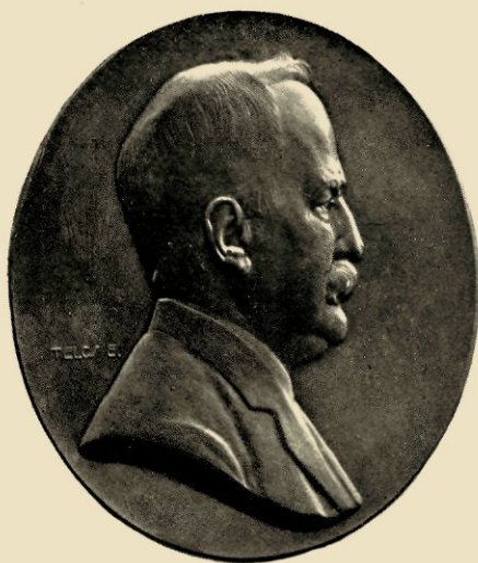
ED. TELCS: BRONZEN PORTRET MEDAILLE (WARE GROOTTE)