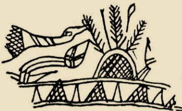
AFB. 9. FRAGMENT VAN EEN GEDECOREERDE TRIDACNA- SCHELP UIT AEGINA

wij het motief op Griekschen bodem aan, in Aegina, op gegraveerde schelpen (afb. 9), waar het wordt aangeduid als een ronde boog die gearceerd is, waaruit primitief getekende plantenstengels te voorschijn komen, nog juist als planten te herkennen door de ganzen die erin pikken, tot het motief tenslotte een onbegrepen dood sterft in Etrurië.