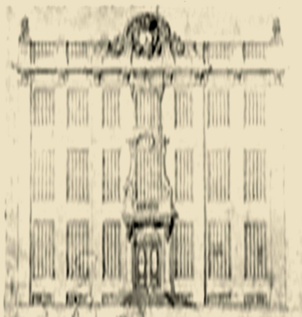
AFD. 4. GEESTELIJK. GEWED. DOOR DANIEL MAREL VOOR DENZELFEN. GRAVE