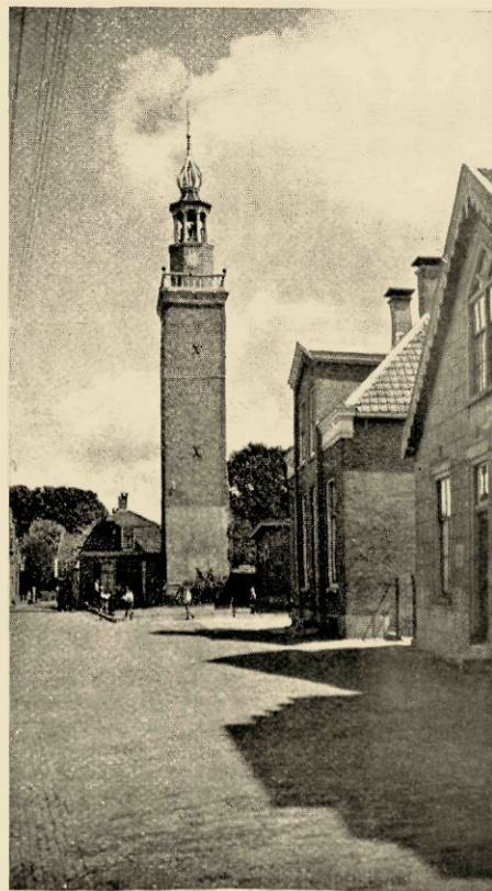
De toren van Nieuwkoop

„Dat ben ik gaarne eens,” krijg ik ten antwoord,