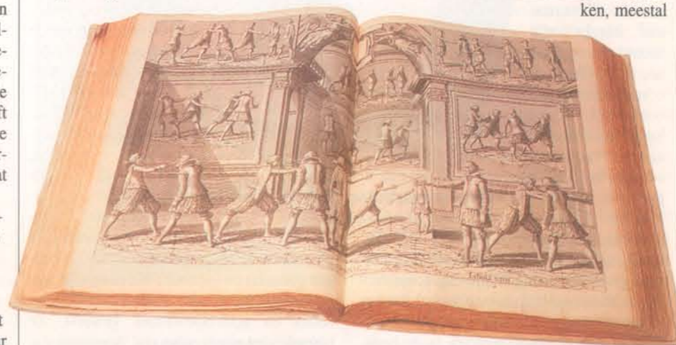
Een van de fraaiste boeken uit het Elzevierfonds: over de schermkunst met 46 gravures

Lodewijk Elzevier vestigde zich daartussen en maakte snel naam. Hij was bedreven en vindingrijk in zijn vak en hij ontwikkelde een voor die tijd modern boekenbedrijf. Hij was een van de eerste handelsreizigers in boeken, meestal