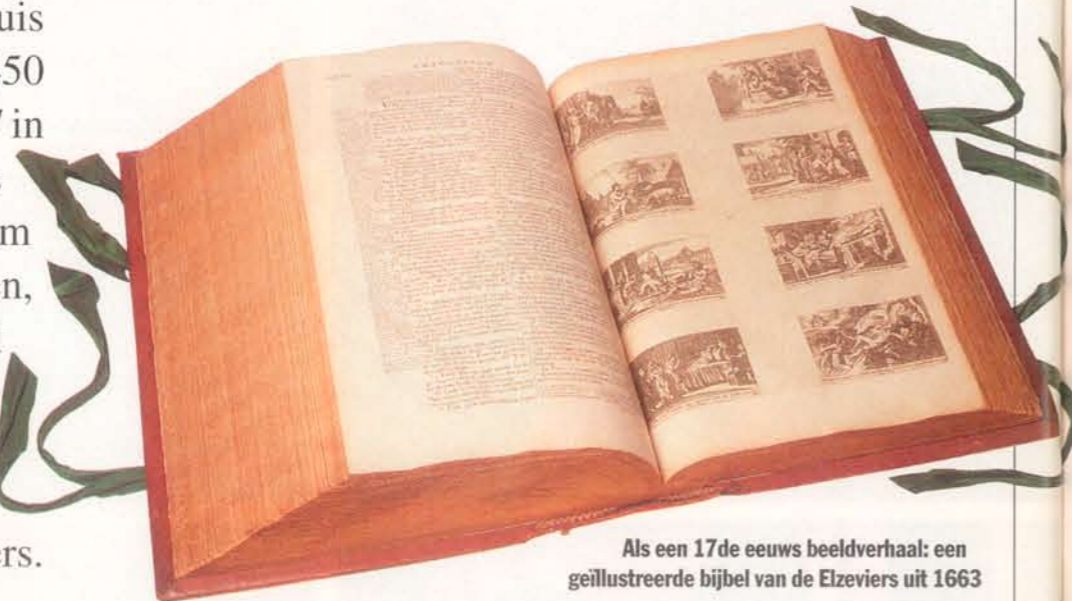
Als een 17de eeuws beeldverhaal: een geïllustreerde bijbel van de Elzeviers uit 1663

Hij was boekbinder, Louis Helsevire, en werd 450 jaar geleden in 1547 in Leuven geboren. Als Lodewijk Elzevier kwam hij in 1580 naar Leiden, begon een boekwinkel en werd de stamvader van een dynastie. Van meesterdrukkers en boekverkopers.