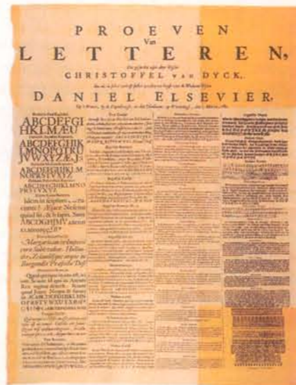
Een proef van de Elzevier-letters