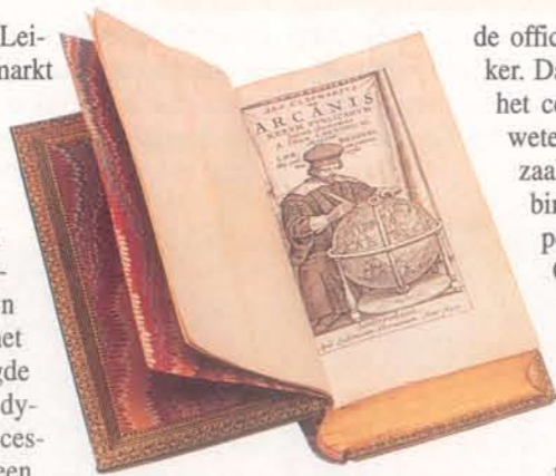
Een pocket van Elzevier, uit de reeks onder aan de pagina's